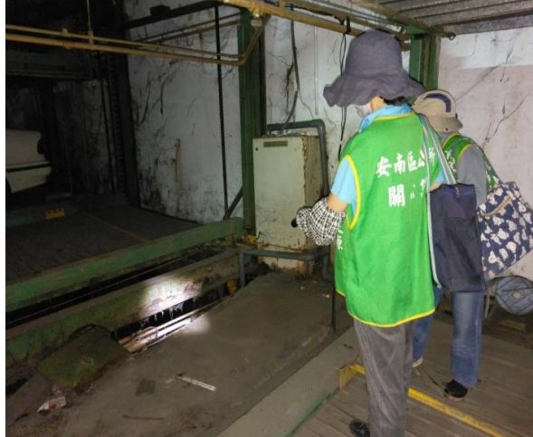
南興里安南居易大樓